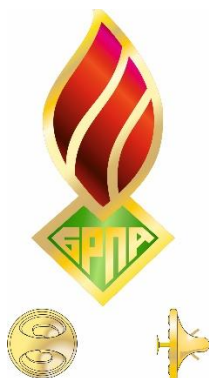
Значок «Центральный Совет»