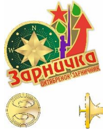
Новая визуализация БРПО, талисман БРПО